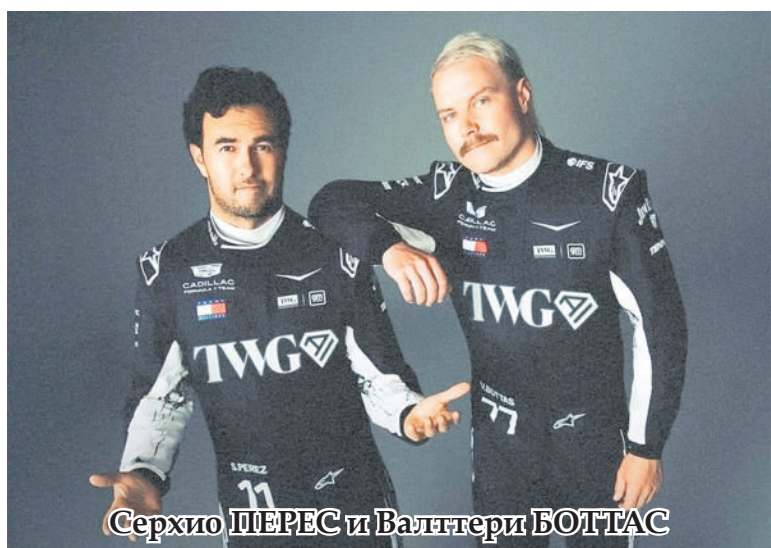
Серхио ПЕРЕС и Валттери БОТТАС