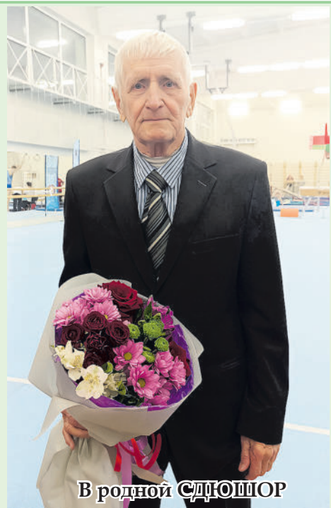
В родной СДЮШОР

Оптимизм, юмор, душевное тепло, здоровье и бодрость пусть будут неизменными спутниками этих лет! Юбилейное время от времени посещает спортивные мероприятия в родной СДЮШОР «Кольца славы», где проработал около 4-х десятков лет, вплоть до 80-летия. В настоящее время с удовольствием проводит зимние морозные дни в окружении внуков. Все партии в шашки с ними либо выигрывает, либо играет вничью! Его лозунг по жизни дети знают наизусть: «Работайте, работайте, а слава вас найдет!» Долгих и качественных лет жизни имениннику!